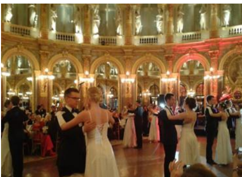
Unsere Tanzschüler beim Österreicherball Nos élèves au bal autrichien