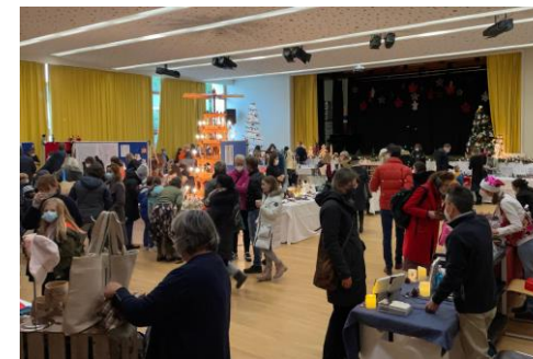
Weihnachtsmarkt Marché de Noël