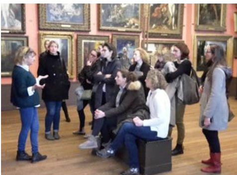
Stadt- und Museumsführungen Visites guidées