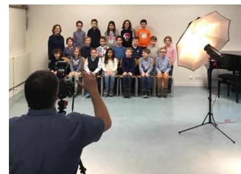
Schulfotograf Photos de classe