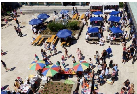
Sommerfest Fête de l'été

Marché de Noël Fête de l'été Visites guidées (Paris et musées) Cours de danse (pour les élèves et les parents) Soirées dansantes/bals Café Bonjour et accueil des nouveaux arrivants Photos de classe