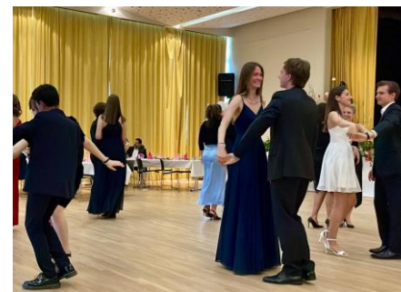
Tanzkurse Cours de danse

Alle Einnahmen aus diesen Aktionen kommen direkt der Schule und den Kindern zugute.