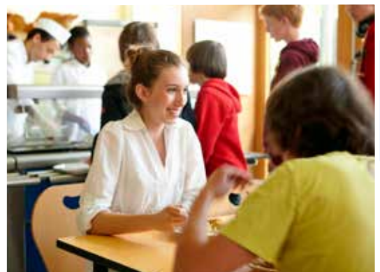
Mittagspause in der Kantine - Erholung und Miteinander.