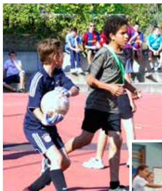
Sportplatz und Turnhalle.