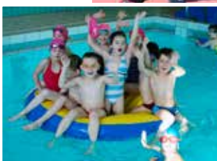
Beheiztes Schwimmbad für Schwimmunterricht ab dem Kindergarten.