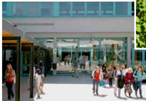
Eine großzügige Aula.