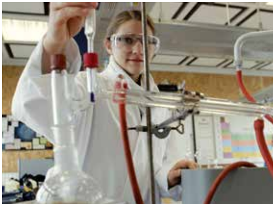
Die Fachräume der Naturwissenschaften gleichen Laboren mit moderner Technik mit interaktiven Tafeln.