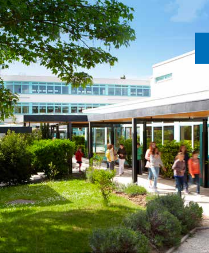
Bäume und Rasen, großzügige Spiel- und Sportanlagen.

... Sie bietet am Rande der Weltstadt Paris eine attraktive Architektur in schöner Natur. Sie hat gut geführte Einrichtungen und ist hochmodern ausgestattet. Neben Apfelbäumen, Gemüsegarten und der „Villa Poulette“ mit Hühnern für die Kleinen trifft man auf moderne Einrichtungen und offene Begegnungsbereiche. Licht, Flächen und Nischen, Platz zum Lernen, Sitzen oder Spielen : Lebensraum innen und außen.